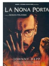
La nona porta di Roman Polanski , (1989, USA) Video Adulti Fiction POL

Un impiegato di biblioteca fornisce della documentazione ai giornalisti che indagano sullo scandalo Watergate. Bella panoramica dall'alto della Library of Congress.