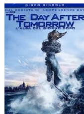
L'alba del giorno dopo di Roland Emmerich , (2004, USA) Video Adulti Fiction EMM

Il protagonista, giovane avvocato gay colpito dall'AIDS, si reca in biblioteca per cercare delle informazioni. Il bibliotecario si dimostra scortese e non lo aiuta.