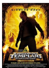
Il mistero dei Templari di Jon Turteltaub , (2004, USA) Video Adulti Fiction TUR

Indiana Jones a Venezia in cerca di suo padre, scomparso mentre era sulle tracce del Santo Graal, si reca in una biblioteca, ubicata in una chiesa sconosciuta.