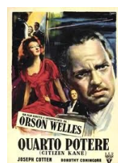
Quarto potere di Orson Welles , (1986, Francia/Italia) Video Adulti Fiction WEL

La ricerca del tesoro dei Templari segue un intricato percorso fatto di indizi, archivi nazionali, inseguimenti... .. per scoprire che il tesoro comprende anche le pergamene della Biblioteca di Alessandria!