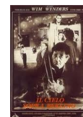
Il cielo sopra Berlino di Wim Wenders , (1987, Germania) Video Adulti Fiction WEN

Alla morte del magnate della stampa Charles Foster Kane, un giornalista viene incaricato di scoprire il significato dell'ultima parola che egli ha pronunciato in punto di morte: "Rosabella". Il giornalista si reca presso l'austera Biblioteca della Fondazione Thatcher, per consultare le memorie segrete del signor Thatcher, dove viene accolto da una bibliotecaria severissima, con occhialini, capelli corti e in divisa, che gli intima di consultare solo le pagine che si riferiscono a Kane e di lasciare la biblioteca entro le 16,30.