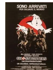
Ghostbusters - Acchiappafantasma di Ivan Reitman , (1984, USA) Video Adulti Fiction REI

Ambientato nel mondo dei bibliofili e delle loro biblioteche, si basa su tre esemplari lievemente diversi della medesima antica edizione di "Le nove porte del regno delle tenebre". Una breve scena in una biblioteca pubblica, quando il protagonista cerca notizie su suddetto testo.