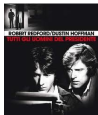
Tutti gli uomini del presidente di Alan Pakula , (1976, USA) Video Adulti Fiction PAK

Qui si ritrova Boris, un pugile stanco della sua fama che incontra il sognatore Grigori e Greta, la bibliotecaria della città. La loro relazione sfocia in un triangolo dove l'amore non segue i desideri dei protagonisti.