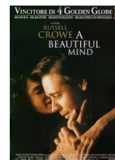
A beautiful mind di Ron Howard , (2001, Gran Bretagna) Video Adulti Fiction HOW

Film del genere "catastrofico" in cui il pianeta è minacciato da una nuova glaciazione. Uno dei protagonisti resta isolato da una tempesta nella Public Library di New York. Il dramma umano raccontato si svolge – significativamente- tutto lì dentro, con numerosissime inquadrature di interni ed esterni (molto suggestive, con la biblioteca immersa prima nell'acqua e poi nella neve). Tra le scene: (1) Per riscaldarsi vengono bruciati in un caminetto i volumi della biblioteca. Un bibliotecario salva però una Bibbia di Gutenberg, dicendo "Per me l'invenzione della scrittura è stata la più importante. Se la civiltà occidentale deve scomparire voglio salvarne almeno un pezzetto". (2) Per curare una ragazza ferita la bibliotecaria suggerisce l'uso di penicillina. Alla domanda "Come lo sai?", risponde "I libri non servono solo per bruciarli", con in mano una enciclopedia medica.