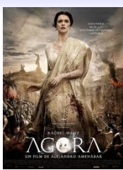
Agora di Alejandro Amènar , (2009, Spagna) disponibile da giugno 2012

Alessandria d'Egitto. Seconda metà del IV secolo dopo Cristo. La città in cui convivono cristiani, pagani ed ebrei è anche un vivo centro di ricerca scientifica. Vi spicca, per acume e spirito di indagine, la giovane Ipazia, figlia del filosofo e geometra Teone, che tenta di salvare la biblioteca dalla barbarie.