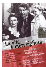
La vita è meravigliosa di Frank Capra , (2009, Spagna) Video Adulti Fiction CAP

Nel 1327, Guglielmo di Baskerville giunge in un monastero francescano in cui si sono verificate alcune morti misteriose. Il segreto di questi omicidi è da cercare proprio nella biblioteca del monastero in cui il vecchio bibliotecario cieco nasconde i libri "proibiti".