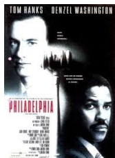
Philadelphia di Jonathan Demme , (1993, USA) Video Adulti Fiction DEM

Al protagonista, George, che ha deciso di suicidarsi, viene data l'opportunità di "vedere" come si sarebbe svolta la vita nella sua città e l'esistenza dei suoi cari se lui non fosse mai nato. Così la moglie viene mostrata come una bibliotecaria insipida e zitella dall'aria assolutamente triste e smarrita, sottolineata dai classici occhialini e dai capelli rigorosamente acconciati. Tutt'altro tipo rispetto alla donna vivace, intraprendente e sicura di sé (nonché felice, ovviamente) che lui ha sposato. In un'altra scena, George risponde alla domanda di Violet: "Finirò col ficcarmi in biblioteca" e lei: "George, a che cosa ti serve leggere tanti libri?". "Già" risponde George e le propone di andare a fare una passeggiata a piedi nudi nell'erba, suscitando l'indignazione di Violet e le risate di alcune persone che hanno seguito la conversazione.