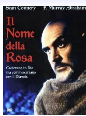
Il nome della rosa di Jean-Jacques Annaud , (1986, Francia/Italia) Video Adulti Fiction ANN

Alessandria d'Egitto. Seconda metà del IV secolo dopo Cristo. La città in cui convivono cristiani, pagani ed ebrei è anche un vivo centro di ricerca scientifica. Vi spicca, per acume e spirito di indagine, la giovane Ipazia, figlia del filosofo e geometra Teone, che tenta di salvare la biblioteca dalla barbarie.