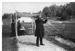
Oscar Swahn 1912 tiro al bersaglio mobile

Olimpiadi di Pace. Storie e racconti per amare lo sport