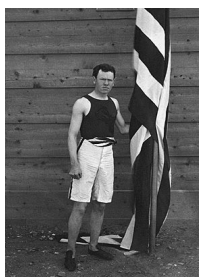
Jeames Brendan Connolly 1896 Salto Triplo

Olimpiadi di Pace. Storie e racconti per amare lo sport