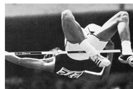
Richard Douglas Fosbury 1968 salto in alto

Olimpiadi di Pace. Storie e racconti per amare lo sport