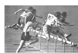
Trebisonda "Ondina" Valla 1936 80m ostacoli

Olimpiadi di Pace. Storie e racconti per amare lo sport